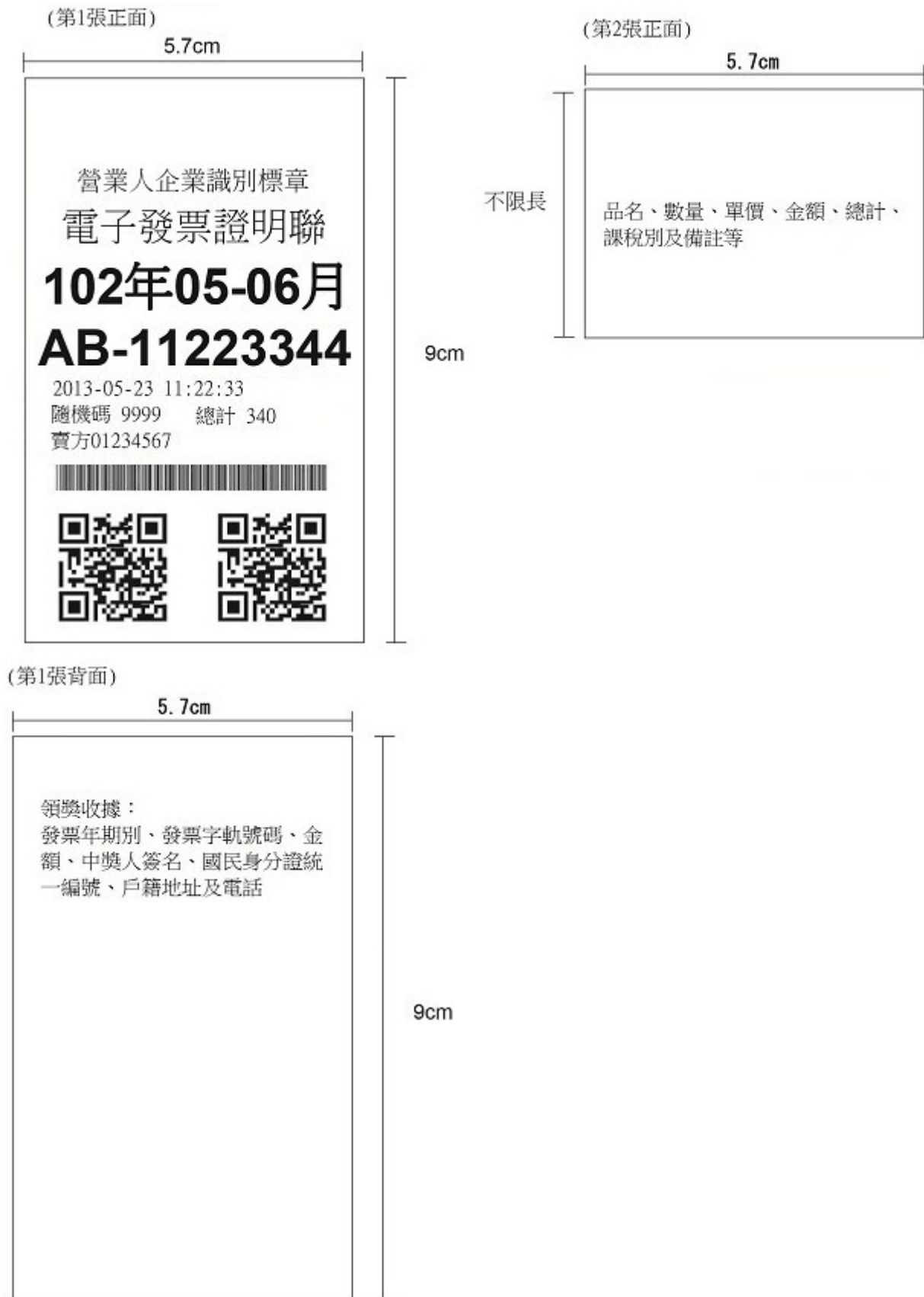
圖 1-1 買受人為非營業人之格式(範例)